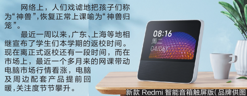
新款 Redmi 智能音箱触屏版(品牌供图)