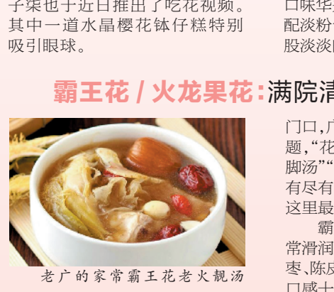
老广的家常霸王花老火靓汤