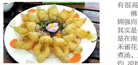
朱雀花做的菜你吃过吗?