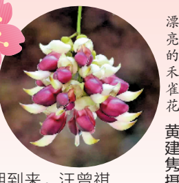
漂亮的朱雀花

说到吃花,老广肯定少不了传统的霸王花和近年来大热的火龙果花,这是不少人吃花的第一印象。广东人对霸王花汤有多爱?在佛山南海盐步的“九记路边鸡”店