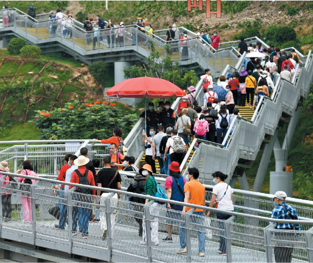
16日早上,不少市民逛云道