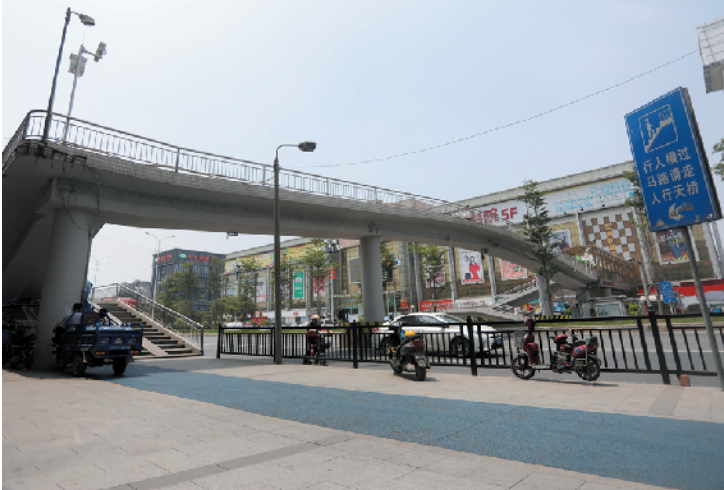
黄埔东路沙涌天桥现状