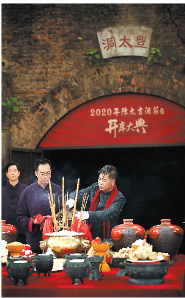
陈太吉酒庄开库大典现场,嘉宾们共同举杯庆祝。

当,形成西方有“罗曼尼康帝”酒庄、东方有“陈太吉酒庄”的国际酒庄格局,推动实现中国白酒“走出去”的恢弘大业;对内,在庄主使命担当的引领下,使酒庄文化人格化并聚焦到“欢乐生活”“干酒文化”等酒庄核心理念,赋予酒庄消费者、体验者和参与者由心追求的品生活活意义。