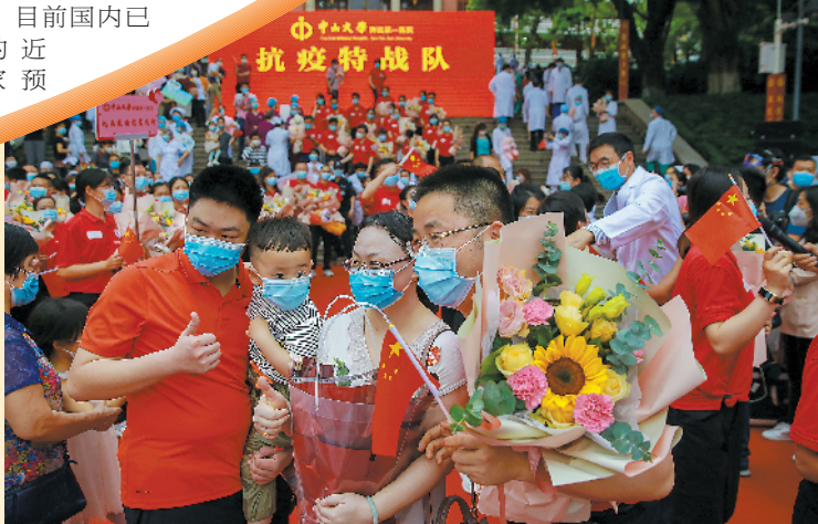
▼医疗队队员与家人合影

约景区中，自然风光类景区占比最高，达到30%，其次是名胜古迹、主题乐园及城市观光类景区。相关人士提醒游客，目前各地已开园景区中，不少需要至少提前1天预约方可入园。有计划出行的游客应做好预约安排。