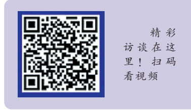
精彩访谈在这里！扫码看视频

兴证全球基金（原“兴全基金”）近日发布公告称，将于5月7日起正式发售公司旗下的首只沪港深产品——兴全沪港深两年持有期混合型证券投资基金。公告显示，兴全沪港深基金是一只设置了两年的最短持有期的基金产品。兴证全球基金相关负责人表示，持有时间越长，实现正收益的概率更高，且平均收益率水平也更高。根据产品合同，兴全沪港深投资于股票资产的比例为60%-95%，其中港股通的投资比例不得低于非现金资产的80%，可以同时分享A股跟港股的投资机会。 （杨广）