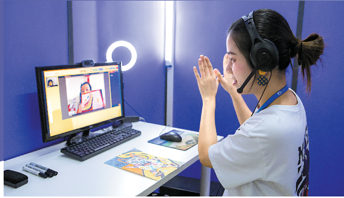
机构老师在线上授课

面对萌芽中的蓝海市场，机遇与风险并存。好的业态模式需要经过市场检验，才能更好地吸引资本注入，一场教育政策改革下的应试教育与素质教育的接力，或许正在发生。