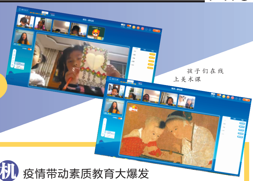
孩子们在线上美术课