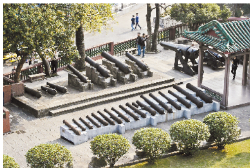
镇海楼前至今仍保存着数排铁炮

开幕之日，镇海楼按照地球地质陈列、动植物标本、矿物标本、古物及艺术品、革命纪念馆及各国文史资料为顺序，首次全面展陈藏品。当天的来宾超过一万人，另据《广州民国日报》报道，开幕之后三星期，每日参观的游客“均在六七万人以上”。