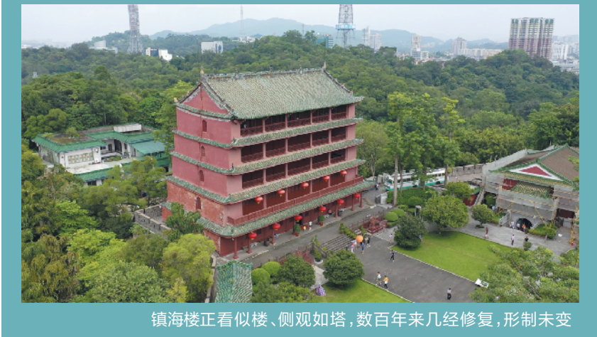
镇海楼正看似楼、侧观如塔，数百年来几经修复，形制未变