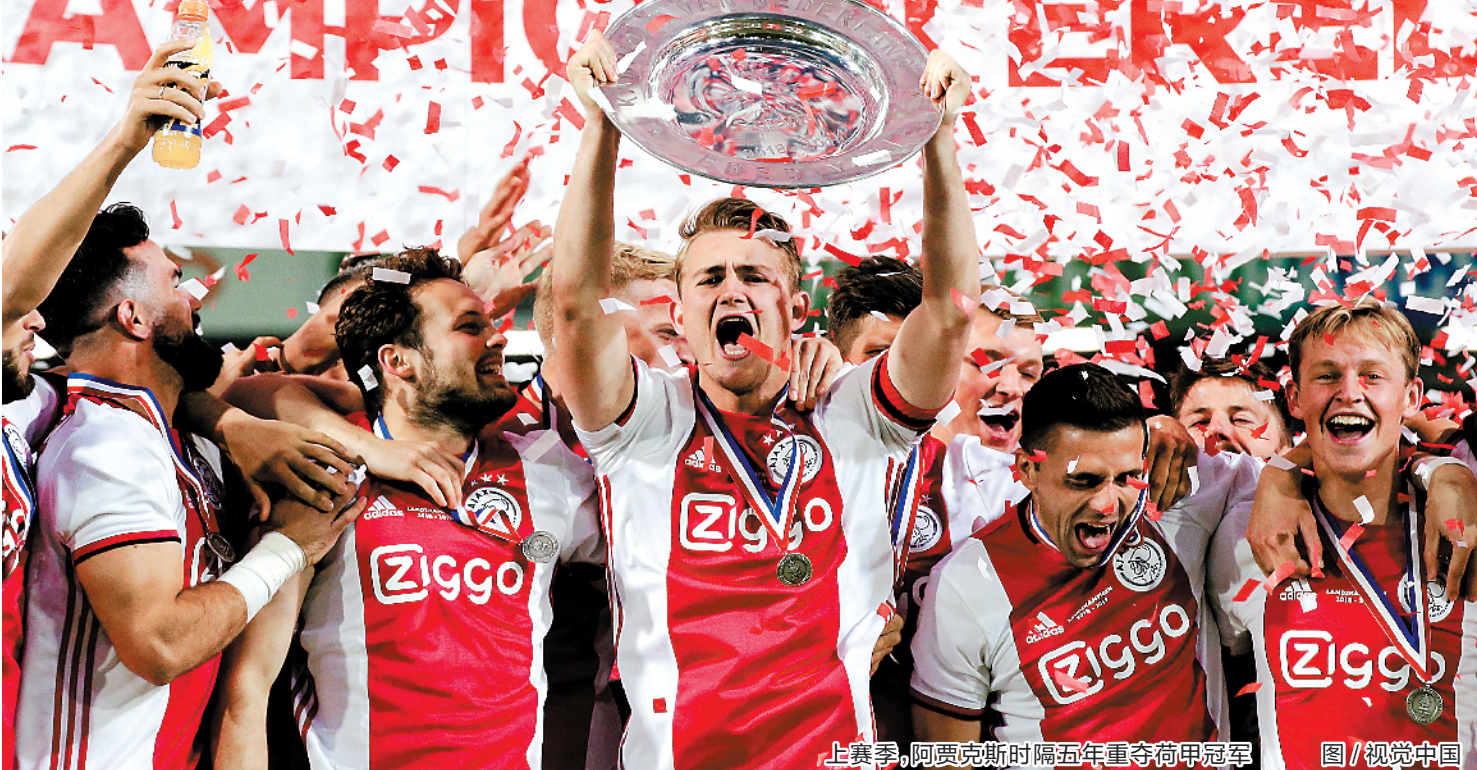
上赛季,阿贾克斯时隔五年重夺荷甲冠军