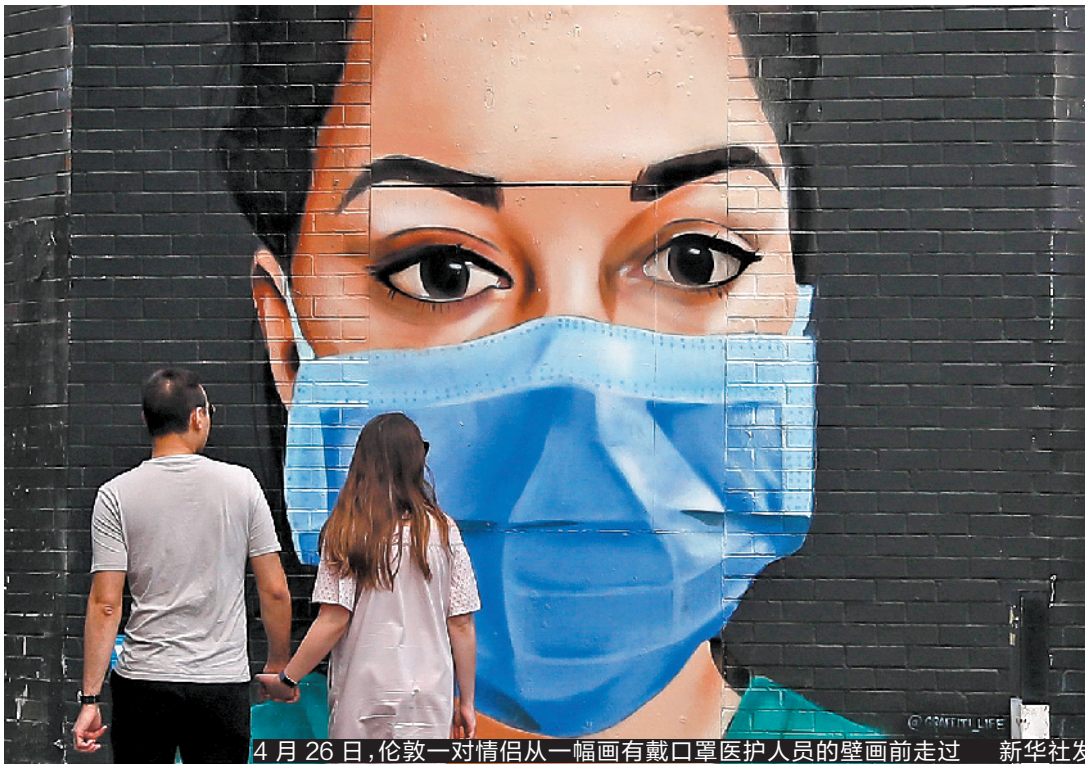
4月26日,伦敦一对情侣从一幅画有戴口罩医护人员的壁画前走过