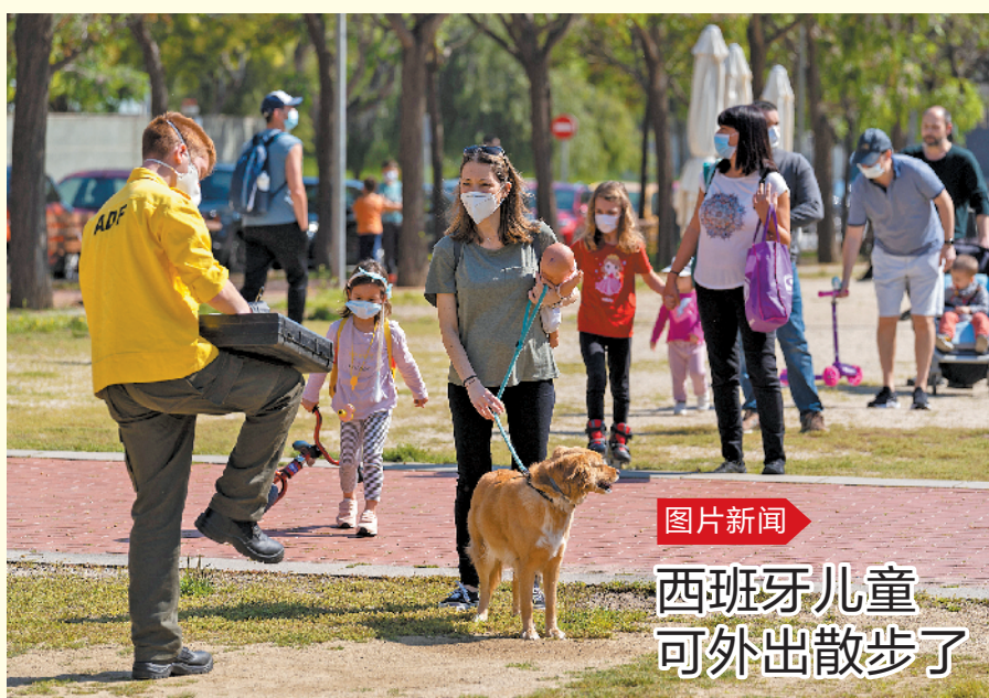
西班牙儿童可外出散步了

新冠病毒疫情席卷全球,一些航企想招儿弥补损失,比如把没人坐的闲置客机用于货物运输。加拿大航空公司甚至改装机体,拆除乘客座椅,以增加装载量。 航班大规模停飞导致货运紧张,再加上口罩等防疫物资运输需求高涨,其中部分线路的运费一度涨至原先的几倍。一些航空公司批准商机,调整业务方向。 共同社报道,日本航空从3月以来开始把客运航班改为国际货运航班。这些航线的目的地多数在东亚和欧美国家,相关客运航班则作停飞处理,大约1200趟航班已经或将要被调整。全日空仅4月份就有超过300趟客运航班被改造为货运航班,飞往中国等地。两家公司都已开始使用行李架装载货物,以充分利用空间。 还有航空公司不嫌麻烦,改装机体。加拿大航空宣布将把3架客机改装成货机。被改造的机型据称为波音777型,舱内422个座椅将被拆除以增加装货空间。(王宏彬)