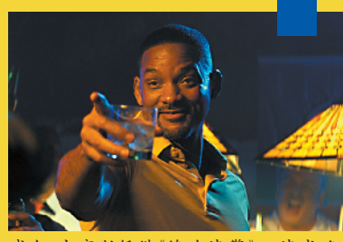
威尔·史密斯凭借《绝地战警》一战成名