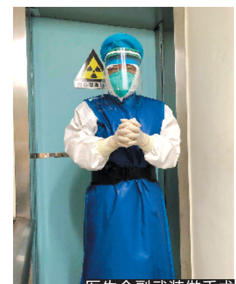
医生全副武装做手术