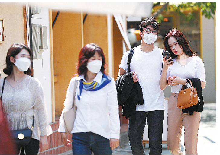
6日,人们在韩国首尔慈惠洞逛街

255例,累计治愈9333例。 韩国鉴于国内疫情形势趋稳,从6日起进入日常生活和防疫工作并行的“生活防疫阶段”,个人基本防疫措施包括勤洗手、周期性消毒和通风换气、人与人之间保持距离、身体不适居家观察等。 泰森食品公司在声明中说,新冠疫情迫使生产放缓,已关闭位于内布拉斯加州达科他城、华盛顿州帕斯科和艾奥瓦州佩里