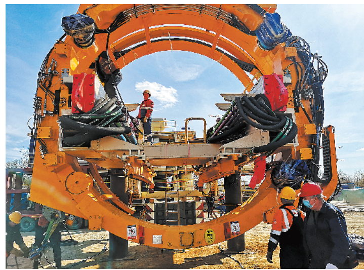
4月9日,在莫斯科,工作人员进行盾构机拼装作业

据新华社电 当地时间5日上午,随着机械轰鸣声响起,直径达10.88米的“胜利号”大盾构机在莫斯科市始发。这台大直径盾构机由中国铁建股份有限公司(中国铁建)自主研发生产,此次始发不仅是这台“大国重器”在俄罗斯首次亮相,也标志着中国企业生产并出口欧洲的最大盾构机正式投入使用。