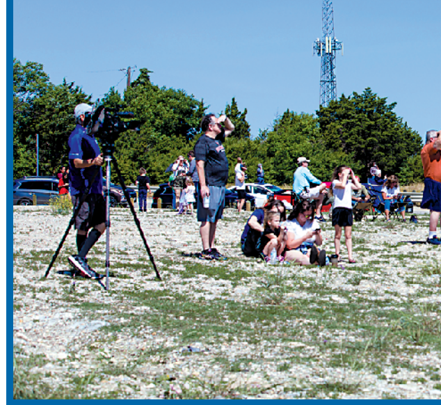
5月6日,人们在得克萨斯州达拉斯市观看飞行表演

美国一名遭贬职的官员5日在一份申诉文件中披露,他1月向政府高层警告新冠病毒对美国的威胁,但后者没有重视,而且“蓄意淡化”疫情威胁。他同时披露,疫情在美国暴发后,政府高层要求大规模投入使用未经公共卫生部门批准的药物,且涉及利益输送。