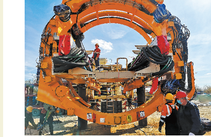
4月9日,在莫斯科,工作人员进行盾构机拼装作业

据新华社电 当地时间5日上午,随着机械轰鸣声响起,直径达10.88米的“胜利号”大盾构机在莫斯科市始发。这台大直径盾构机由中国铁建股份有限公司(中国铁建)自主研发生产,此次始发不仅是这台“大国重器”在俄罗斯首次亮相,也标志着中国企业生产并出口欧洲的最大盾构机正式投入使用。