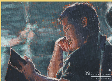
曾国祥画像(作者:周俊辉)

此外，本届金像奖特刊也受到了疫情的影响，最终以插画代替拍摄，邀请香港和内地多位插画师为提名者创作画像。