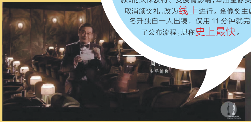
尔冬升宣布获奖名单

昨日下午，第39届香港电影金像奖在线上揭晓获奖名单，《少年的你》12提8中，夺得最佳电影、最佳导演、最佳女主角、最佳新演员、最佳编剧、最佳服装造型设计、最佳摄影、最佳原创电影歌曲。周冬雨首次在金像奖捧杯，获得最佳女主角奖；易烊千玺获得最佳新演员奖，这也是他的首个电影奖项；导演曾国祥也首次拿下最佳导演奖项。而最佳男主角奖则由《叔·叔》的太保获得。受疫情影响，本届金像奖首次取消颁奖典礼，改为线上进行。金像奖主席尔冬升独自一人出境，仅用11分钟就完成了公布流程，堪称史上最快。