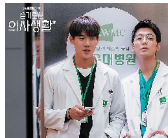
通过细节刻画表达细腻情感