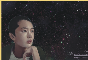
周冬雨画像(作者:宋易格)