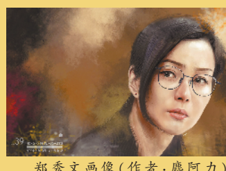
郑秀文画像(作者:廖阿力)

不过，一家欢喜一家愁，另一位最佳女主角大热人选郑秀文今年同时以《花椒之味》和《圣荷西谋杀案》入围最佳女主角，可惜再次抱憾而归。这已经是她第六次获得金像奖最佳女主角的提名，遗憾的是始终未能如愿。