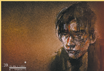
易烊千玺画像(作者:任哲)