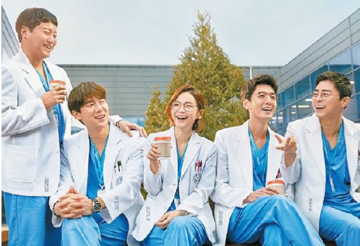
《机智的医生生活》海报