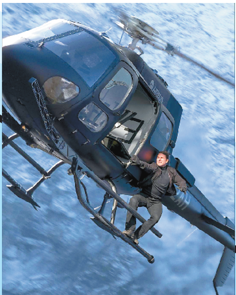
阿汤哥在《碟中谍6》中扒直升机

即便是以监狱人生为主题的《机智的监狱生活》，也同样讲述了友情故事。“西部监狱2舍栋6号房”里，狱友之间、狱友和狱警之间都建立了深厚友谊。与《机智的医生生活》一样，《机智的监狱生活》的人物设置同样有反转：不食人间烟火的棒球投手金济赫，其实是有勇有谋的战