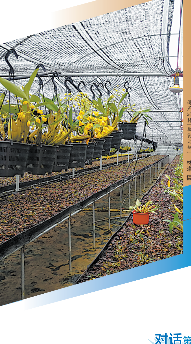
羊城晚报记者 李志文 周寿光