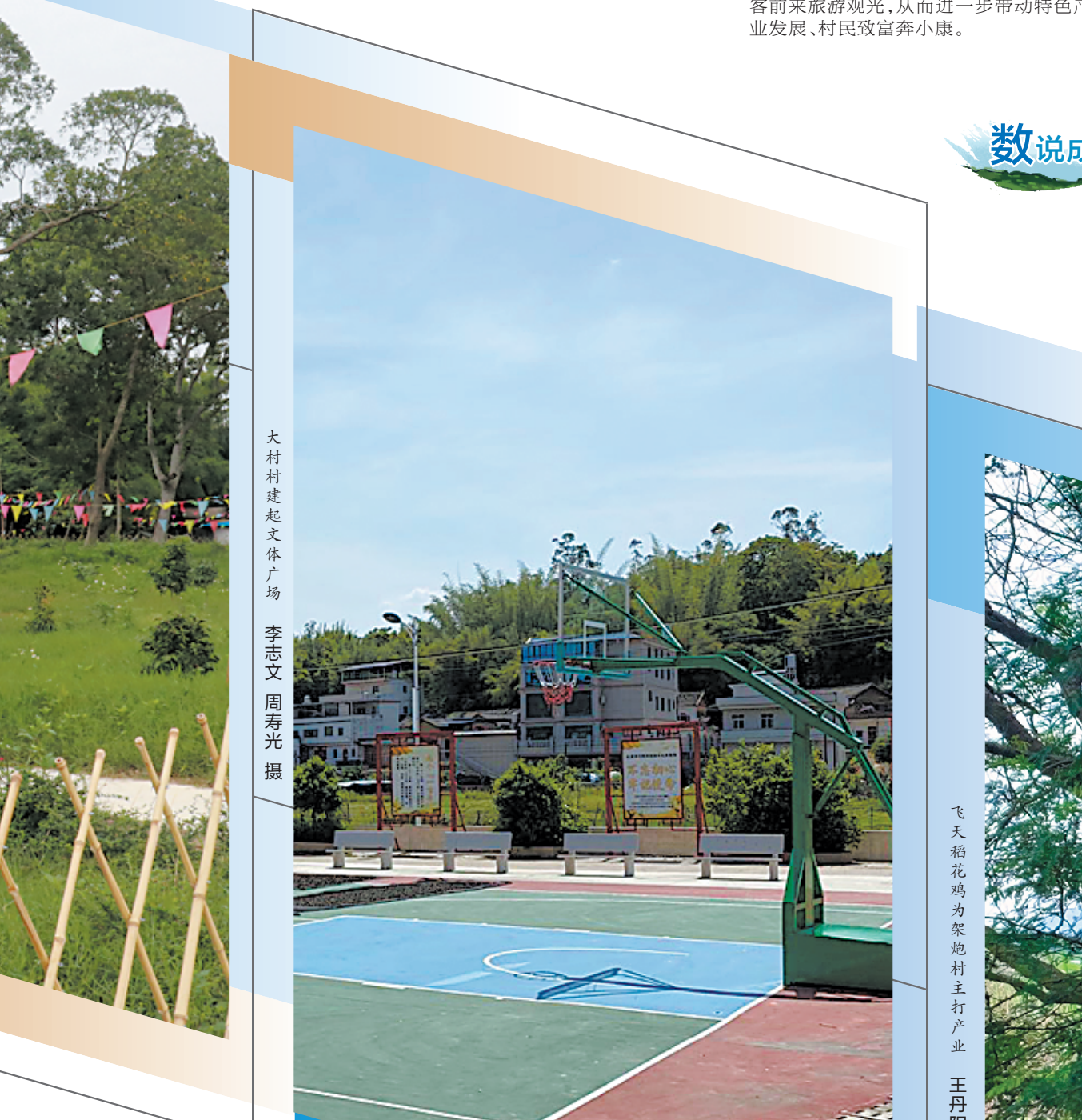
低涌村使用公厕成村民生活便利

谈到村子的未来，张伟华说，架炮村原与泮水夫人出生地山兜村是一个大村，后来才分开。下一步，扶贫工作队将以泮水夫人故里文化为基础，打造乡村文化旅游文化，推进美丽乡村建设，吸引更多游客前来旅游观光，从而进一步带动特色产业、农民增收奔小康。