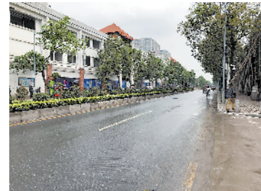
▲ 大坦沙门户道路整改前 ► 大坦沙桥中公交站场整改前