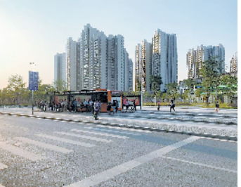
◀ 大坦沙门户道路整改后 ▼ 大坦沙桥中公交站场整改后

据透露,荔湾区还将以创新驱动赋能、串联产业链条,在岛上布局“互联网+”智慧医疗,建立集健康管理、医疗服务、药品服务、保险服务一体化的互联网医院服务模式,支持第三方机构构建医学影像、健康档案、检验报告、电子病历等医疗信息共享服务平台。