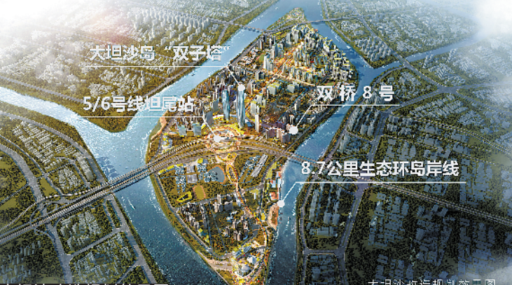
大坦沙改造规划效果图

两核,以广州呼吸中心为“核”心健康产业综合基地,结合岛南文化娱乐“核”心区,建设宜居宜业游的国际健康生态岛。一是以广州呼吸中心为龙头,推动形成医疗健康产业的企业总部、医疗培训、先进体检、国际高端会议的集聚区,打造驱动健康医疗产业的跨产业延伸、多功能复合的产业社区圈;二是岛南的文化娱乐集聚核,主体开发结合养生体验、休闲健康、商务旅游,建设一批高端健康生态旅游设施,开发生态湿地公园、建设度假酒店和游艇码头,推动商务旅游高端发展。