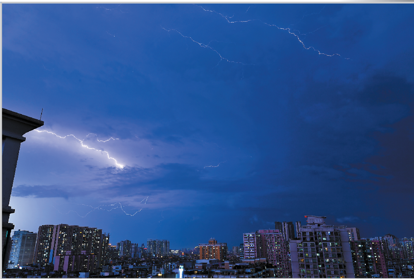
11日傍晚,广州风雨大作,闪电如银蛇舞

广州有13个测站录得暴雨以上量级降雨,27个测站录得8级以上阵风 荔湾南源街录得全市最大雨量61.7毫米,黄埔大桥站录得全市最大阵风10级