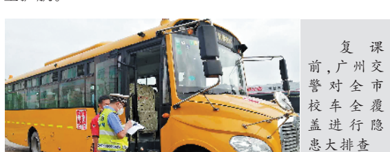
复课前,广州交警对全市校车全覆盖进行隐患排查

针对大部分校车受疫情影响停运时间较长、可能存在安全隐患的情况,5月11日开学前夕,广州交警联合各级教育、交通等相关部门,分批次、有序对全市4445辆校车全覆盖进行隐患排查,重点检查校车车辆状态、号牌标识、随车安全设施等内容。