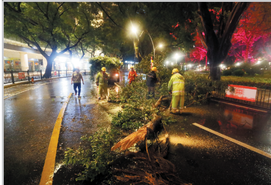
11日晚,侨光路有树木倒下,绿化抢险队及时处理