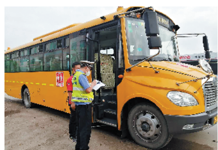
复课前,广州交警对全市校车全覆盖进行隐患排查

针对大部分校车受疫情影响停运时间较长、可能存在安全隐患的情况,5月11日开学前夕,广州交警联合各级教育、交通等相关部门,分批次、有序对全市4445辆校车全覆盖进行隐患排查,重点检查校车车辆状态、号牌标识、随车安全设施等内容。 此外,严把校车驾驶人安全关。广州交警联合各区公安分局禁毒大队,对全市校车驾驶人通过毛发采样检测的形式进行全面“涉毒”排查,为返校师生交通安全护航。