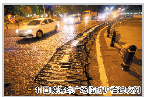
11日晚海珠广场临时护栏被吹倒

11日晚,受强对流云团影响,广州的越秀、天河、荔湾、海珠、花都多区都出现了强雷雨天气,并伴有8-10级雷雨大风。广州市气象灾害应急指挥部于18时54分起启动广州市气象灾害(暴雨和雷雨大风)Ⅲ级应急响应。此外,越秀区、天河区、荔湾区、花都区、黄埔区当晚还发布了冰雹橙色预警信号。在恶劣天气下,广州市区多处道路出现树倒水浸现象。