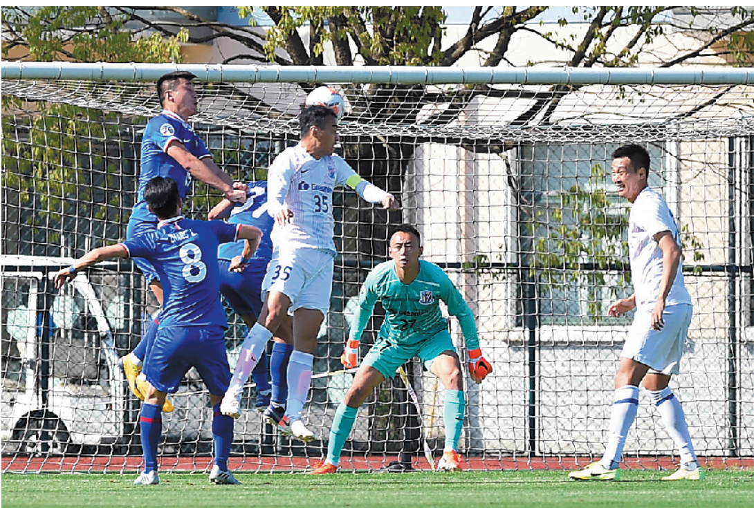
上海申花“蓝白争霸赛”次场最近进行，在中超尚未开赛的这个特殊时期，继续给球迷“解渴”