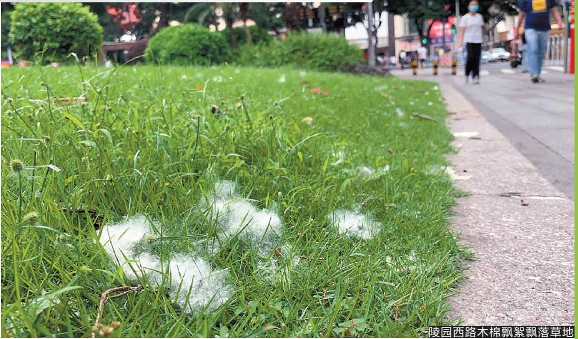
陵园西路木棉飘絮飘落草地

随风传播,这是木棉种子扩散的一种机制。”华南农业大学植物学博士黄久香向记者介绍道,“但是在晴朗大风的初夏季节,它容易随风飘舞进入人的呼吸道,对一些过敏体质的人来说可能会造成呼吸道的相关疾病。”她提到近期天气晴好,比较暖和,有利于花授粉成功和果实成熟,所以木棉的结果数量比较多,棉絮也会相对多一些。