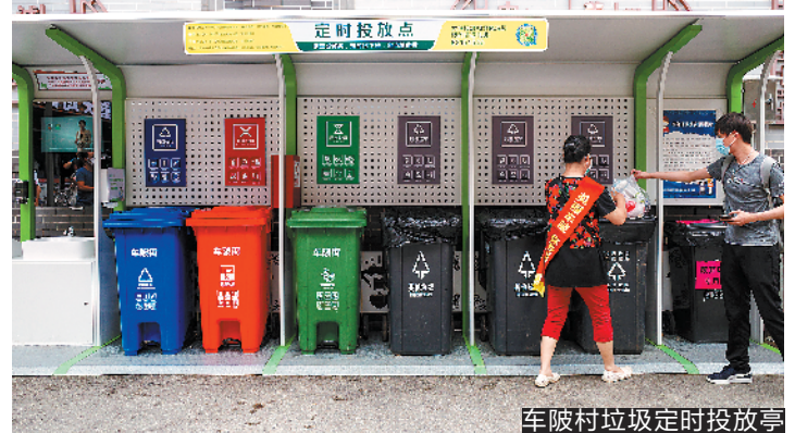
车陂村垃圾定时投放亭

车陂村垃圾分类另一大特点是设置四个定点投放时间段,分别是6:30-10:00、13:00-14:00、16:00-17:00、19:00-21:30。中午和下午为短假期,重点回收其他垃圾和可回收物。