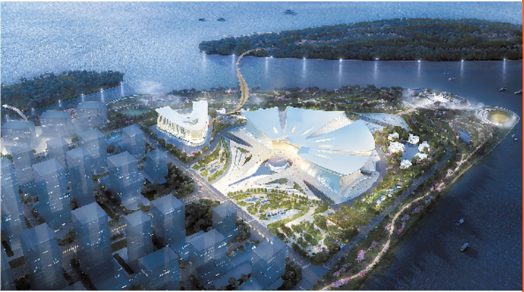
国际金融论坛(IFF)永久会址效果图

国际性和地域性相结合的建筑特质。主入口布置相对中轴对立而设,车道的仪式感随进入逐步增强,极好地渲染了会议的礼仪性。建筑形态处理简练、高效、优雅,结构与建筑相互间的处理恰到好处,很好地解决了南方气候遮阳、防风、通透的需求,突出了地域性。主会场的设计则创造性地解决了3000人同时参会的使用需求,具备极高的灵活性和可变性。项目选址于广州市南沙新区明珠湾区横沥岛尖东侧,是大湾区建设的标志性工程,项目主要包含国际会议中心、国际会议服务酒店等部分。项目总投资约35亿元,总建设工期约30个月。