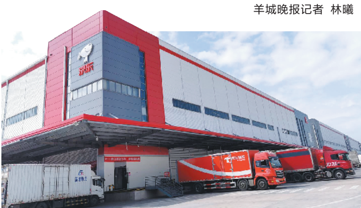
羊城晚报记者 林曦

考虑到疫情复发的不确定性和常态化防控的重要性,中国足协将积极整合各方意见,继续优化、完善联赛的疫情防控方案和赛事计划。优化后的方案仍有待有关部门批准。