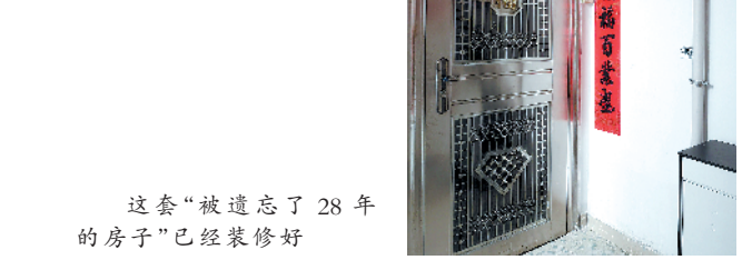
这套“被遗忘了28年的房子”已经装修好