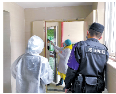
疫情期间家庭医生参与抗“疫”

羊城晚报讯 记者王俊摄影报道:5月19日是“世界家庭医生日”,记者18日从深圳市卫健委获悉,目前深圳全市共有2568个家庭医生团队,全市重点人群签约率达72%。而在享受原有签约服务的基础上,今年起,签约家庭医生后市民在社康看病还能享受“优先权”。