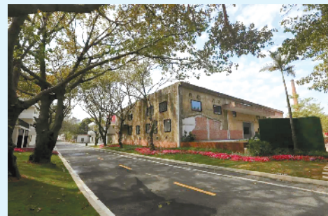
改造后的鳐鱼洲成“天然网红直播间”