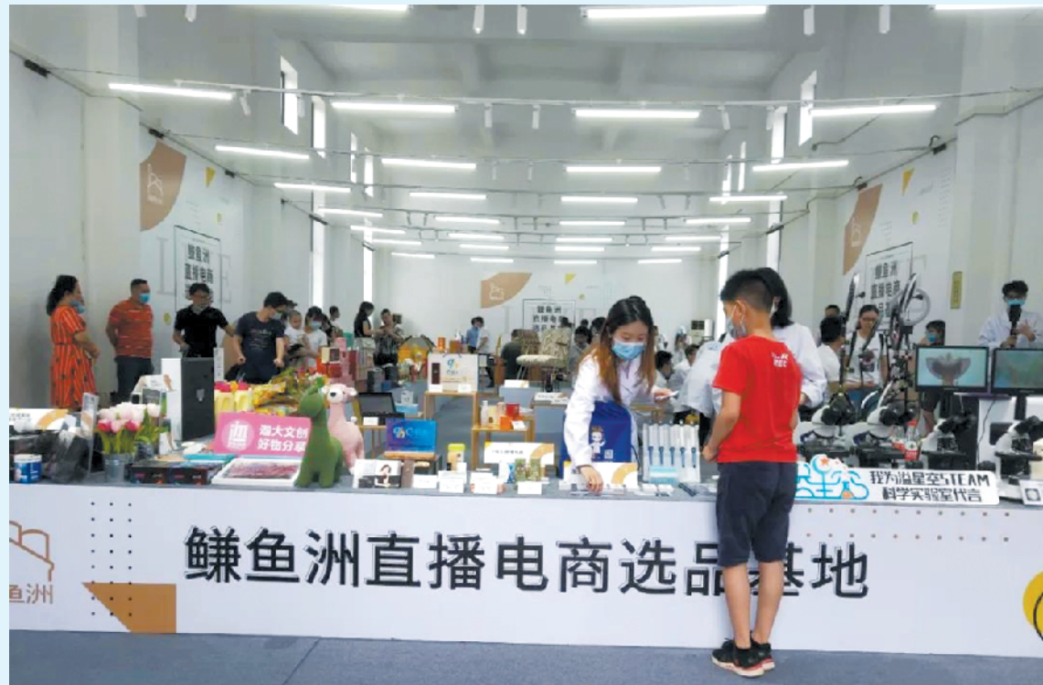
鳐鱼洲直播电商选品基地现场