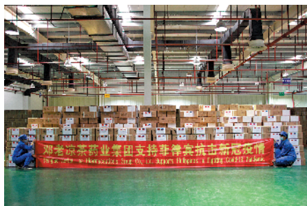
支持菲律宾抗击新冠肺炎疫情

疫情期间,邓老凉茶药业向疫情重灾区黄冈市黄州区捐赠了数十万份的“邓老清冠饮”中药浓缩膏方和邓老凉茶颗粒冲剂,提供给当地10万社区居民服用。同时,邓老中药浓缩膏方也参与了梅州市两家定点医院的临床辅助治疗,梅州市累计确诊的16例病例全部治愈出院,创造了零死亡、医护人员零感染的成绩。