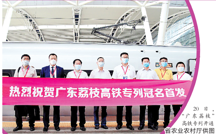
20日，“广东荔枝”高铁专列开通

羊城晚报讯 记者许悦报道：20日，“广东荔枝”高铁专列以爱之名，在“520”这个特别的日子里，从广州南站首发，与全国人民共享鲜美。