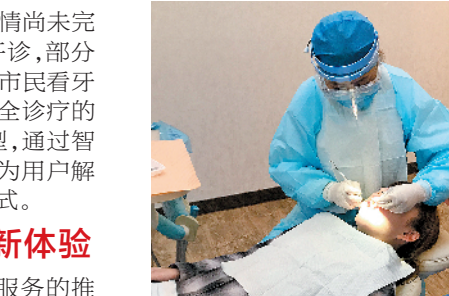
德伦口腔美牙直播间，在线解答口腔问题

百位硕博学位专家团入驻云诊所，开通了线上预约服务。市民可通过关注德伦口腔微信公众号，点击菜单栏“我的云诊所”，根据自己的需求观看专家口腔知识科普视频、进行自主预约，此举有效避免了人员聚集及诊疗途中的交叉感染的风险。这种线下实体防治和线上预约诊疗模式的完美结合，也有利于建立医生与顾客的