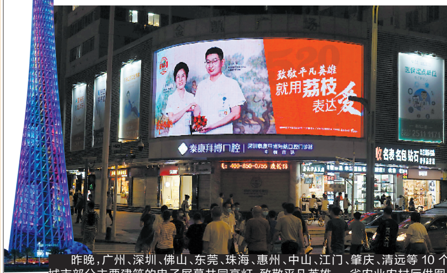
昨晚，广州、深圳、佛山、东莞、珠海、惠州、中山、江门、肇庆、清远等10个城市部分主要建筑的电子屏幕共同亮灯，致敬平凡英雄

羊城晚报讯 记者许悦报道：20日，广州、深圳、佛山、东莞、珠海、惠州、中山、江门、肇庆、清远等10个城市部分主要建筑的电子屏幕共同亮灯，以甜甜蜜蜜的广东荔枝，表达对平凡英雄的敬意。