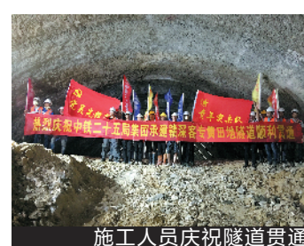
施工人员庆祝隧道贯通

羊城晚报讯 记者李志文,通讯员邓联旭、黄诗伟、欧尧能报道:近日,在大型设备与中铁二十五局作业人员的相互配合下,光束穿透作业面照进隧道内,赣深高铁黄田地隧道宣告顺利贯通。 黄田地隧道全长1285.13米,是赣深高铁4标贯通的第六座隧道,标志着影响后续铺架施工的“卡脖子”工程顺利打通,为下一步河源市东源车站往赣州方向架梁、铺轨提供了有力保障。 赣深高铁是国家中长期铁路网规划的“八纵八横”高速铁路网的重要组成部分,也是连接长三角、珠三角间交流的又一条重要快速通道。建成通