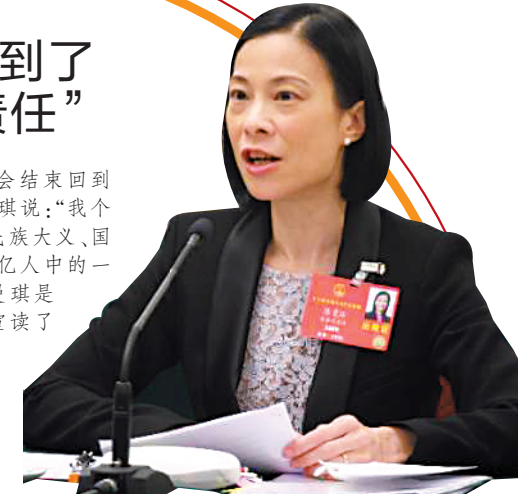
港区全国人大代表陈曼琪

在采访中，羊城晚报记者问陈曼琪：“两会结束回到香港后，您是否担心自己的人身安全？”陈曼琪说：“我个人可能有人身安全方面的风险。不过，这是民族大义、国家所需，也是我自己的专业所长。作为14亿人中的一个，我只是尽到了一个中国人的责任。”