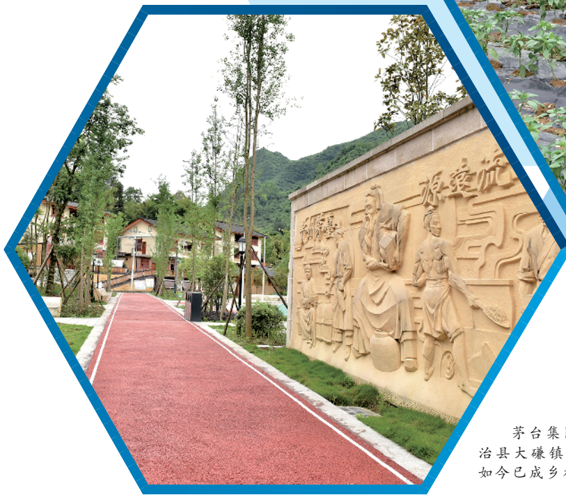
茅台集团投入数千万元资金在道真自治县大碛镇文家坝村进行村容村貌整治,如今已成乡村旅游热点之一