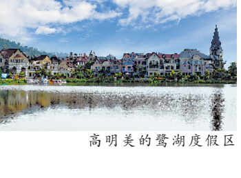
高明美的鹭湖度假区