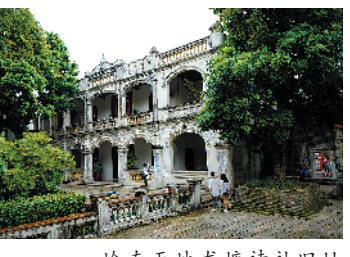
岭南天地龙塘诗社旧址