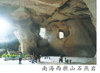
南海西樵山石燕岩