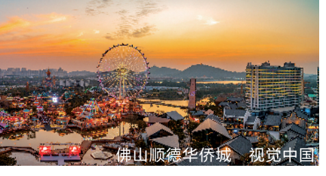
佛山顺德华侨城

都说佛山地区民间历来富庶,最具代表性的莫过于顺德区大良的清晖园,那是广东四大名园之一。它融合了江南园林、岭南庭院及西洋造园手法,于细节处妙趣横生,展现的明清时期岭南建筑园林艺术风格让人赞叹不已。清晖园附近的华盖路步行街,这条典型的骑楼商业街是顺德商业文明的缩影。 南海区西樵镇的西樵山是一座具有四五千年的死火山,不仅是广东四大名山之一,享有国家AAAAA级旅游景区、中国国家森林公园、中国国家地质公园、国家重点风景名胜区的头衔,还被称为“珠江文明的灯塔”。这是我国华南史前时期最早的石器制造场,形成独特的“西樵山文化”,开创了珠江文明之先河。