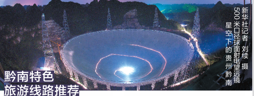
黔南特色旅游线路推荐

位于贵州南部的黔南布依族苗族自治州,是一个充满神秘感且极具诱惑力的多民族聚居区。这里历史悠久、文化灿烂,有着丰富的自然资源和人文景观。 南粤已暑热,而贵州仍在一派春光之中。随着疫情防控形势的好转,贵州知名旅游目的地黔南州的旅游消费也逐渐恢复。 早前,由广州市文化广电旅游局、黔南州文化广电和旅游局(州体育局)指导,广州交易所集团、广州产权交易所及广州文旅资源交易平台、广州精准扶贫综合服务平台联手,根据东西部扶贫协作和扶贫开发的相关工作部署,开始推进广州文旅扶贫·红色旅游之“生态之州·幸福黔南”系列推荐活动。广州文旅扶贫日前在线上继续推进:本期,红色旅游之“生态之州·幸福黔南”,将带你云游世界级美景与多民族人文风情,领略黔南最闪亮的五张旅游名片——