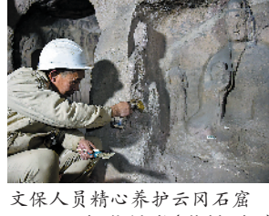
文保人员精心养护云冈石窟

云冈石窟位于山西省大同市西郊武周山北麓,代表了公元5至6世纪时中国杰出的佛教石窟艺术。其中的昙曜五窟,布局设计严谨统一,是中国佛教艺术第一个巅峰时期的经典杰作。1961年被公布为首批全国重点文物保护单位,2001年被列入《世界遗产名录》。 云冈石窟建于北魏兴安年间,大部分是魏孝文帝迁都洛阳以前的作品。现存主要洞窟45个,大小窟龕252个,造像5万1千余尊,形象地记录了印度及中亚佛教艺术向中国佛教艺术发展的历史轨迹,反映出佛教造像在中国逐渐世俗化、民族化的过程。多种佛教艺术造像风格在云冈石窟实现了前所未有的融会贯通,由此而形成的“云冈模式”成为中国佛教艺术发展的转折点。敦煌