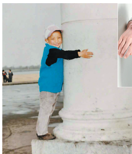
↑↑抱柱子的蓝衣服小朋友,则是从小到大大都可可爱爱的贾乃亮。