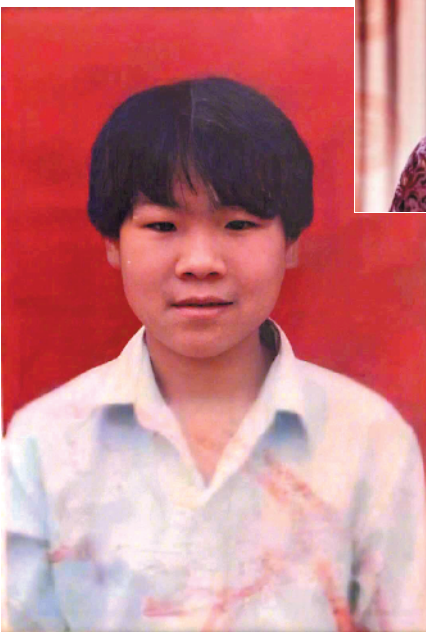
↑↑这位就真的太好认了,正是网友所说的“脸盲症都不会认错”的岳云鹏。

东方卫视真人秀《极限挑战》在六一儿童节晒出了几名“极限男团”成员的童年照,却调皮地“忘记”备注名字。不过,“火眼金睛”的网友们并没有被难倒,大伙儿根据各种细微“线索”,很快猜出了这几名“小朋友”的身份。