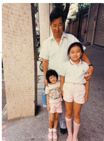
网友联想起自己成长途中失去的亲人而泪目。

在这张带着“怀旧黄”的旧照片里,小小的陈妍希和姐姐一道,站在外公身前。姐姐站得笔直,陈妍希则歪歪地站着,笑得双眼只剩一条缝。网友们纷纷点赞陈妍希“从小可爱到现在”,而陈妍希仿佛也被这张童年照激发了倾诉欲,在评论中一会调侃姐姐的“粉红丝袜”,一会儿自称“我乖我乖我很乖”,之后一句“我很想念我外公”则让不少