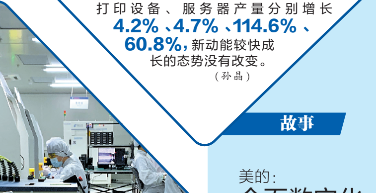
美的：全面数字化 全面智能化

5月13日，福布斯发布第18期全球企业2000强榜单，美的排名第229位，较去年上升24名。美的集团第一季度财报显示海外订单同比增长超25%、全网销售规模同比增长11.7%。