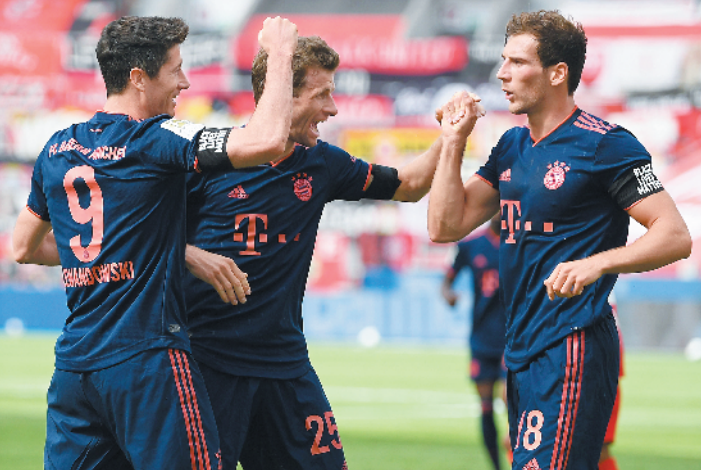
穆勒(中)与莱万(左)双双创造纪录