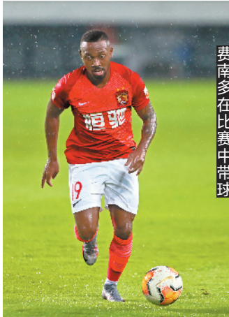
费南多在比赛中带球

按照商业合作伙伴的要求,允许观众入场对于LPGA来说是赛事重启的前提,如果办赛所