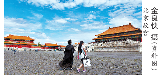
北京故宫(资料图)