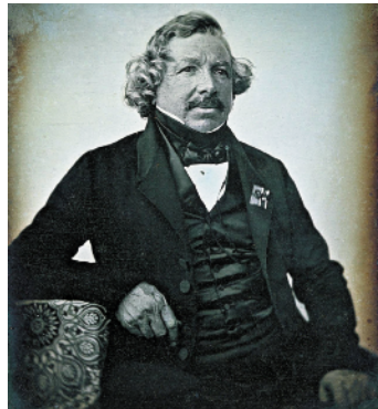
达盖尔 让·巴蒂斯特·萨巴蒂尔·布洛摄于1844年