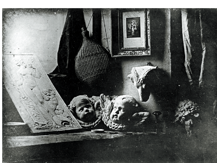
艺术家工作室 达盖尔摄于1837年，为保存下来的世界最早的清晰照片