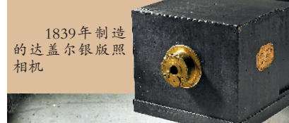
1839年制造的达盖尔银版照相机