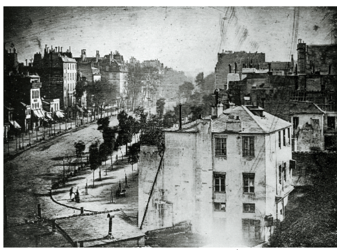
早晨8点 达盖尔摄于1838年