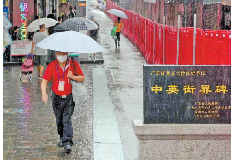
重开的中英街迎来游客

除了取消现场办证,中英街还缩短了开放时间。据了解,中英街北广场正在扩建改造施工,原二楼人行道无法使用。为解决游客通关问题,中英街管理局和联检单位经多次现场调研会商,决定改造学童通道作为游客入关通道。为了避免游客和居民交汇,同时错开学童上学放学时间,目前,中英街每日开放时段为9时至15时(其中,14时停止取证及验证入关,15时前须出关)。 中英街管理局相关负责人表示,开放首日虽然天降大雨,但入关游客仍超千人。本周末是中英街恢复开放后迎来的首个周末,预计人流还会大幅增长。后期,该局也会视疫情防控形势和关口通行能力逐步放宽游客通行量。