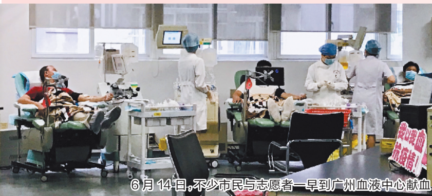
6月14日，不少市民与志愿者一早到广州血液中心献血。

台风“鹦鹉”来临前，微雨的周日早晨，数十位市民与志愿者，来到广州血液中心，安静有序地排队献血。其中一位正在献血的市民对记者表示，先是今年上半年他就已经献血10次了。6月14日是世界献血者日，广州市人民政府新闻办公室也特地选择此时举办第126场疫情防控复工复产新闻发布会，介绍广州市无偿献血的相关情况。