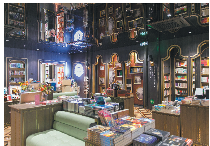
钟书阁用镬耳屋元素装饰内部