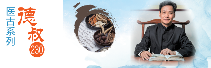
广州中医药大学副校长、广东省中医院副院长 张忠德教授