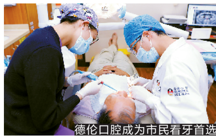
德伦口腔成为市民看牙首选

德伦口腔数字化无牙颌舒适种植牙主要的操作方式,是通过口腔全景片拍摄缺牙患者的口内状况,然后通过数字化取模获取患者的实