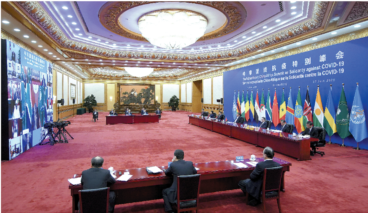
17日晚,国家主席习近平在北京主持中非团结抗疫特别峰会并发表题为《团结抗疫 共克时艰》的主旨讲话。本次峰会由中国和非洲联盟轮值主席国南非、中非合作论坛共同主席国塞内加尔共同发起,以视频方式举行 详见 A2