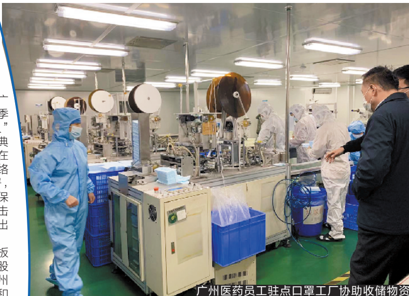
广州医药员工驻点口罩工厂协助收储物资