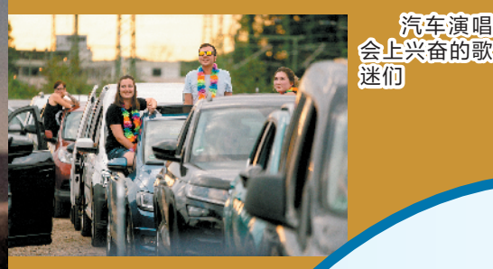
希腊雅典汽车演唱会