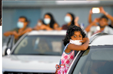
一个小女孩在斯里兰卡科伦坡汽车演唱会上

汽车演唱会的这股风潮也吹到了亚洲。4月底，一场汽车音乐会在韩国京畿道龙仁市的一个公园户外停车场上举行，每辆车的距离保持在两米以上。韩国旅游