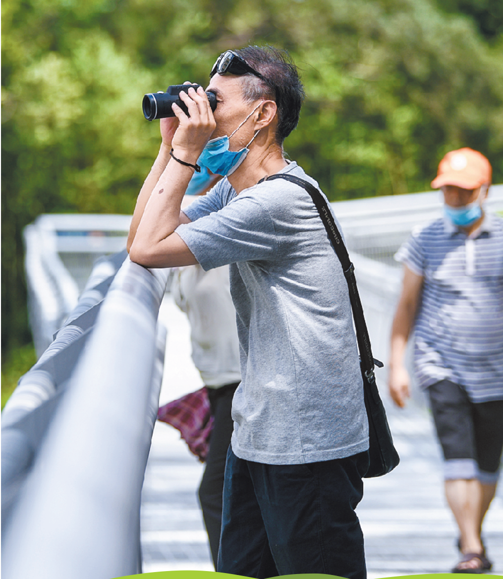
端午假期第二天,不少广州市民走上云道,亲近自然