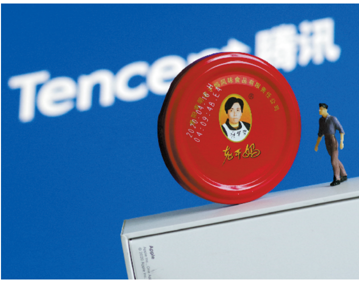
羊城晚报记者 沈钊

就“老干妈”品牌签署《联合市场推广合作协议》，且从未与腾讯公司进行过任何商业合作。老干妈并称，针对上述重大事件，及