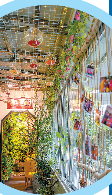
感官花园可以锻炼老年人的视、听、嗅、触、味五种感官

而老人可根据自身照顾等级,选择不同服务套餐,服务内容包生活照料、个人护理、健康管理及精神慰藉等,价格则从1280元/月到7280元/月不等。 她还表示,通过调度中心的后台,可实时查看每个家庭养老床位的情况,例如老人是否在床以及心率、呼吸等。老人如果遇到紧急情况,可以按下紧急呼叫器的按钮一键求救。据悉,家庭养老床位从去年10月份开始试运行,目前全市已经有72张家庭养老床位。