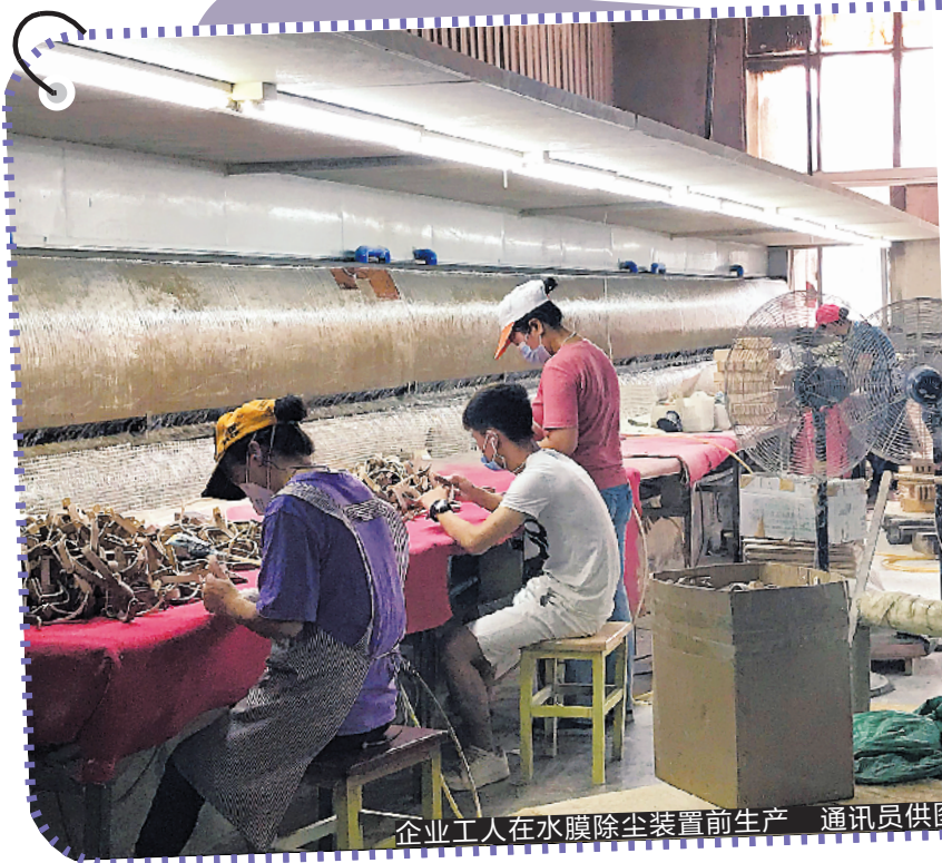
企业工人在水膜除尘装置前生产