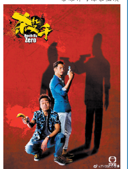
黎耀祥与陈豪主演

对比一下TVB前几年翻车的“创新剧”,比如《兄弟》《解决师》,以及同为监制陈维冠出品的《僵》,就可以发现《杀手》有多聪明:那些剧集都迫不及待地弄出一个高不可攀的设定:《兄弟》让王浩信演了一个呼天唤地无所不能的KOL,《解决师》虚构了一个职业“解决师”(还是王浩信演的),然而TVB可不是HBO,无论是财力还是能力都难以驾驭这种题材。到最后,剧集连“KOL”和“解决师”到底是干什么的都搞不清楚。《杀手》不一样,这部剧一方面有一个讨年轻人喜欢的新颖噱头,另一方面又能发挥TVB所长,讲述接地气的都市故事,虚实之间,还能碰撞出不一样的火花。