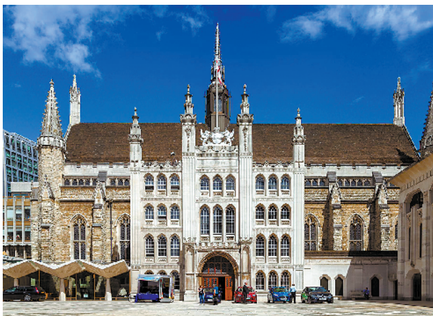
建于1440年的伦敦老市政厅在“伦敦大火”中幸存下来

布拉德沃思市长毫无灭火指挥经验,局势失控,查理二世国王(1630年-1685年)便接过灭火指挥权。他派禁卫军协助开辟防火隔离带,并从军事要塞伦敦塔上发射炮弹炸毁火场周边建筑,加速防火隔离带的开辟。9月6日最终把大火扑灭,保住了政治中心威斯敏斯特。