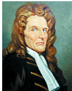
“现代保险之父”尼古拉斯·巴蓬