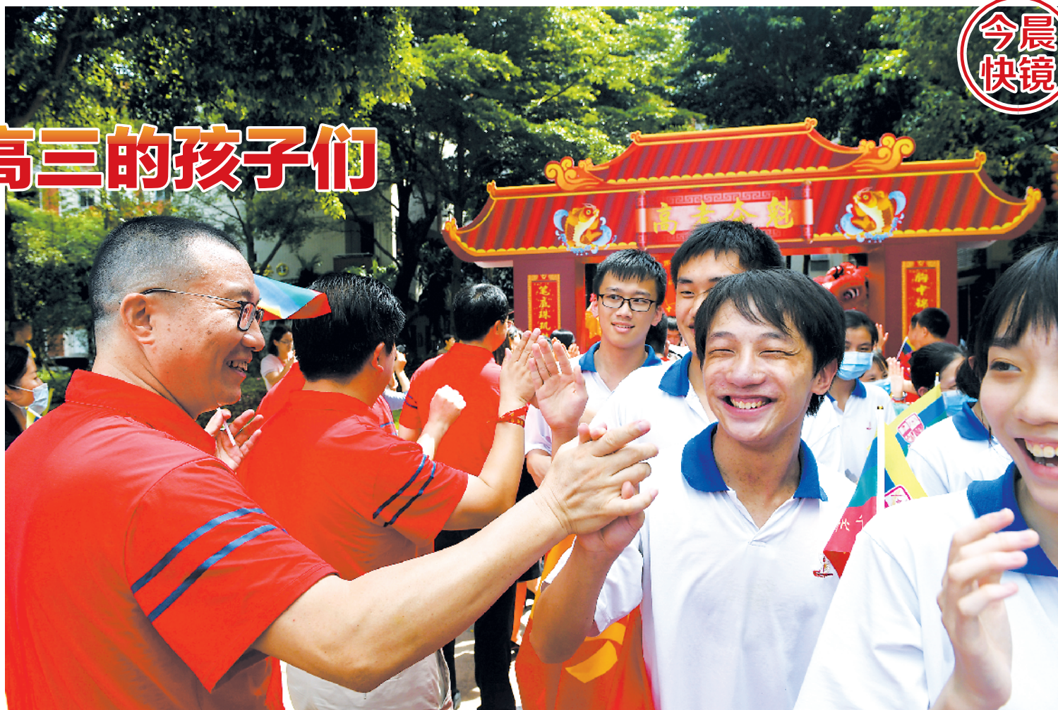
今天上午，送考壮行仪式上，学生与老师一一击掌鼓气

最后，同学们穿过象征着旗开得胜、高考夺魁的“龙门”，与老师们击掌、拥抱。一次次有力的击掌，一声声响亮的呐喊，化为心底最强大的力量。