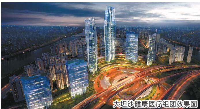
大坦沙健康医疗组团效果图