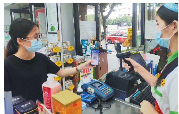
顾客在广州越秀区广园西路20号首层林药店使用医保码

人认证技术,采用加密算法,动态二维码展示,安全可靠,认证唯一。参保人只需进入支付宝市民中心或在支付宝首页搜索“医保码”,即可一键将医保二维码放入支付宝“卡包”。目前,领取医保码还能得到支付宝医保红包和蚂蚁森林能量。据悉,疫情期间,老百姓无接触看病、买药的需求急剧增加。随着国家医保电子凭证工作的快速推进,未来不仅在医院、药店可以方便地使用手机扫码进行医保支付,互联网医院、慢病复开方、网上买药等等也能实现医保在线支付。