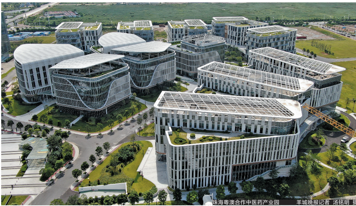
珠海粤港澳合作中医药产业园