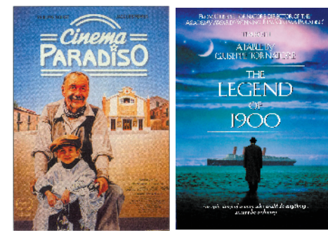
莫里科内为多部经典电影配乐