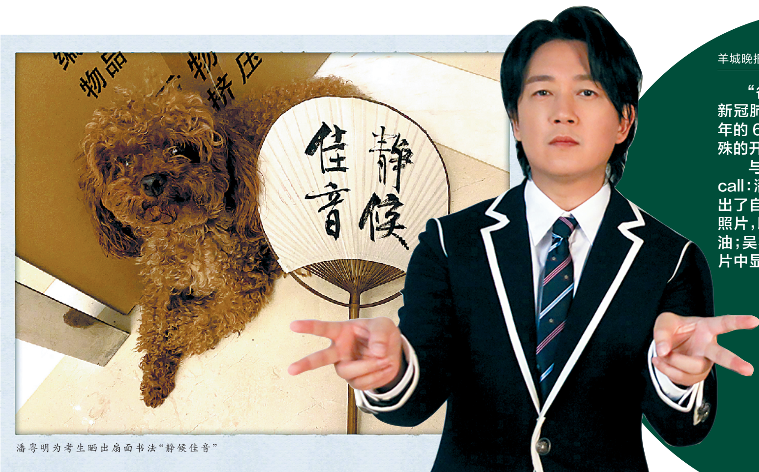
潘粤明为考生晒出扇面书法“静候佳音”