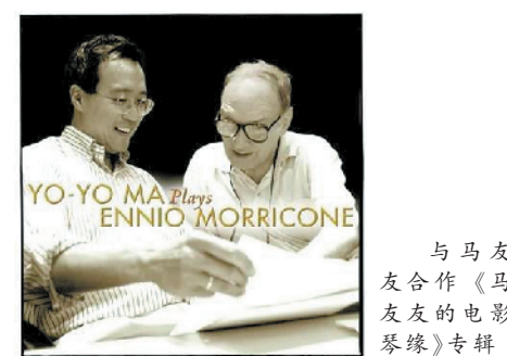
与马友友合作《马友友的电影琴缘》专辑

这张专辑背后，是一个“英雄识英雄”的故事。莫里科内当年凭《西西里的美丽传说》入围奥斯卡原创音乐奖，最后惜败于谭盾的《卧虎藏龙》。在颁奖礼上，马友友现场演奏一曲《卧虎藏龙》，深深打动了莫里科内。他精心挑选了一批自己谱写的经典配乐，并重新编排为大提琴版本，交予马友友演奏。马友友同样非常欣赏莫里科内，这张CD封面上就写有他对莫里科内的赞美：“你是我心中最伟大的音乐家(You are simply my greatest musician)”。