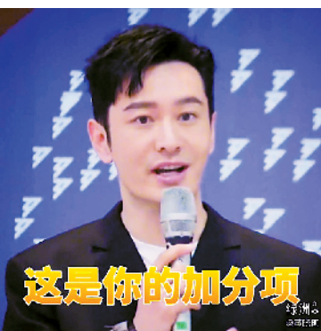
黄晓明引用自己的金句送上祝福

最有趣的是“成团见证人”黄晓明。此前，他在节目首播集中贡献了金句：“这是你的加分项。”7月7日，黄晓明引用了这句话为考生加油：“每道题都是你的加分项！加油。”