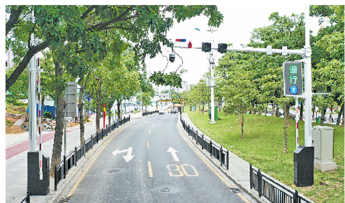
隧道口的闸机系统，天晴时显示屏会打出“通行”字样，让车辆安全驶入